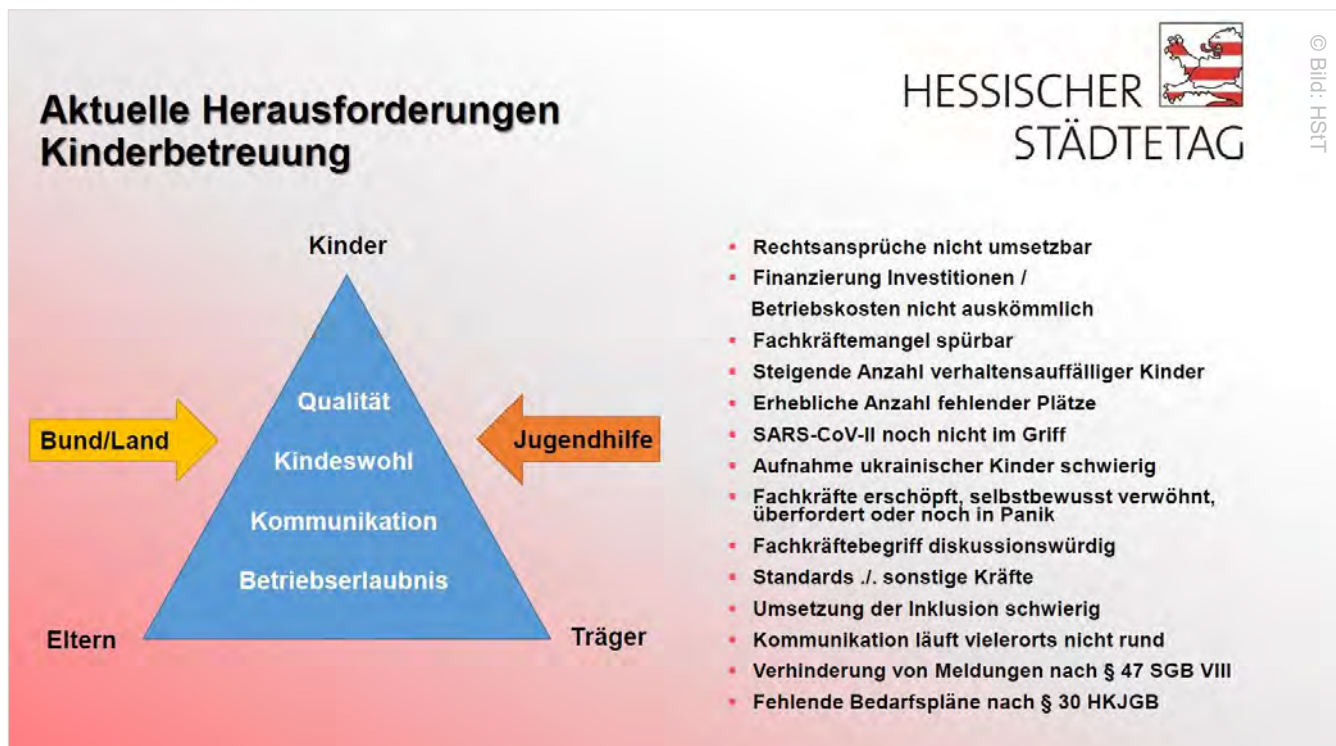
Abbildung: Vielfältig sind die derzeitigen Herausforderungen in der Bildung

immer noch dabei, die Rechtsansprüche auf frühkindliche Bildung, in Kindergärten und in der Kindertagespflege umzusetzen. Personalmangel, fehlende Räume, Pandemie und herausfordernde Verhaltensauffälligkeiten von Kindern beschäftigen sie dabei sehr. Geben Bund und Land schon verpflichtend umzusetzende Rechtsansprüche vor, sollen sie dies in ihre Entscheidungen einbeziehen, entsprechende Möglichkeiten schaffen dies flexibel umzusetzen, und das erforderliche finanzielle Engagement aus originären Bundes- und Landesmitteln nicht vermissen lassen. Die Städte fordern daher eine baldige aktuelle Bedarfserhebung und Planung des Landes.