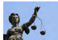
Recht, Personal und Ordnung

Hessischer Städtetag auf dem Zukunftskongress Staat und Verwaltung 2022 16