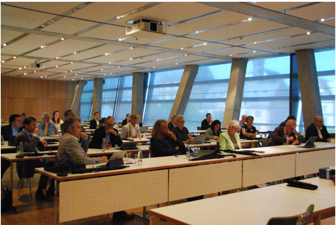
Das Kongresszentrum darmstadtium bot optimale Rahmenbedingungen.

Unter Berufung auf die Datenschutzgrundverordnung (DSGVO) hat im Jahre 2020 ein ehemaliges Mitglied einer Stadtverordnetenversammlung einer hessischen Kommune gefordert, dass ihr Name aus sämtlichen Sitzungsprotokollen entfernt wird. Die ehemalige Mandatsträgerin stützte ihre Forderung auf Art. 17 Abs. 1 DSGVO, in dem das sog. "Recht auf Vergessenwerden" normiert ist. Die Verwaltung kam dieser Forderung nach. Dies war mit einem erheblichen organisatorischen Aufwand verbunden. Der Name wurde dabei nicht nur aus allen elektronischen Dokumenten entfernt, sondern auch in allen gedruckten Protokollen handschriftlich geschwärzt. Hierbei ist anzumer-