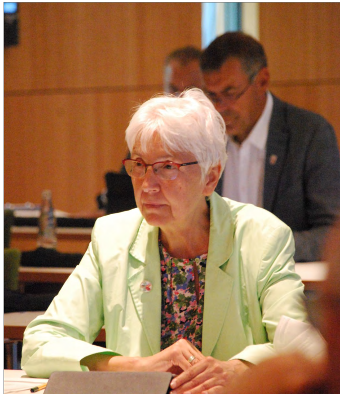
Bild: StRin Gerda Weigel-Greilich. Präsidium und Hauptausschuss wollen klarere Formulierungen für Ganztag und Digitale Bildung im Hessischen Schulgesetz.

gen. Unser konkretes Ziel ist: Jedes Schuljahr 50 weiterführende Schulen mehr im Profil 3 (an fünf Tagen pro Woche in der Zeit von 7:30 Uhr bis 16:00 oder 17:00 Uhr Betreuung, Unterricht sowie verpflichtende Ganztagsangebote als pädagogisches Konzept für den ganzen Tag).“