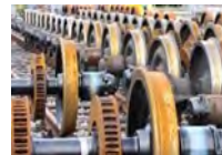
Wirtschaft und Verkehr

Die Mitwirkungsrechte des Ausländerbeirats in kommunalen Gremien 17