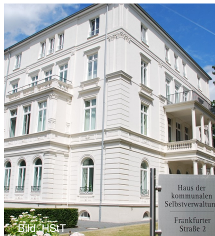
Haus der Kommunalen Selbstverwaltung (HdKS) - seit 2006 befindet sich dort die Geschäftsstelle des Verbandes.

Zum Erwerb des Gebäudes schlossen sich der Hessische Städtetag, der Hessische Landkreistag und die GVV Kommunalversicherung mit Hauptsitz in Köln zusammen.