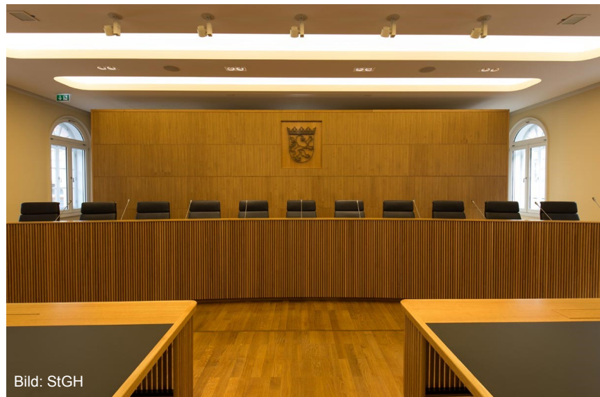
1994 ist die Geburtsstunde der Aktivlegitimation der Städte beim StGH

1989 fand eine Kommunalwahl statt. Die Städte beschäftigten sich erstmals mit dem papierarmen Büro. Verabschiedet wurde zudem eine Resolution zur Integration von Aussiedlern und Zuwanderern.